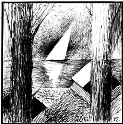
rys. Ryszard Kuba GRZYBOWSKI