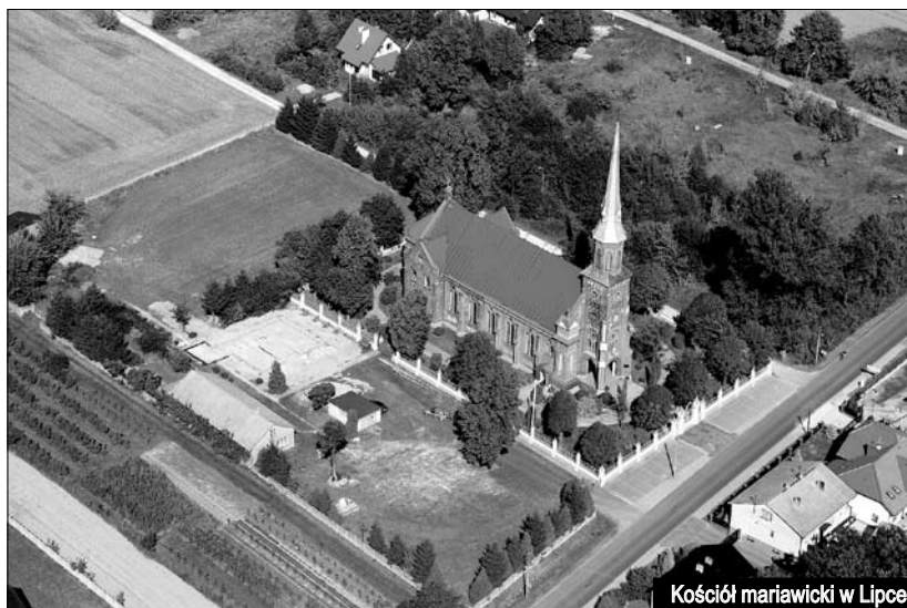
Kościół mariawicki w Lipce

Na realizację tego wieloetapowego zadania, trwającego od 2008 roku, udało się pozyskać 500 tysięcy złotych z Europejskiego Funduszu Rolnego na rzecz Rozwoju Obszarów Wiejskich na lata 2007-2013 oraz 208 tysięcy z Wojewódzkiego Funduszu Ochrony Środowiska w Łodzi. Dzięki tym dofinansowa-