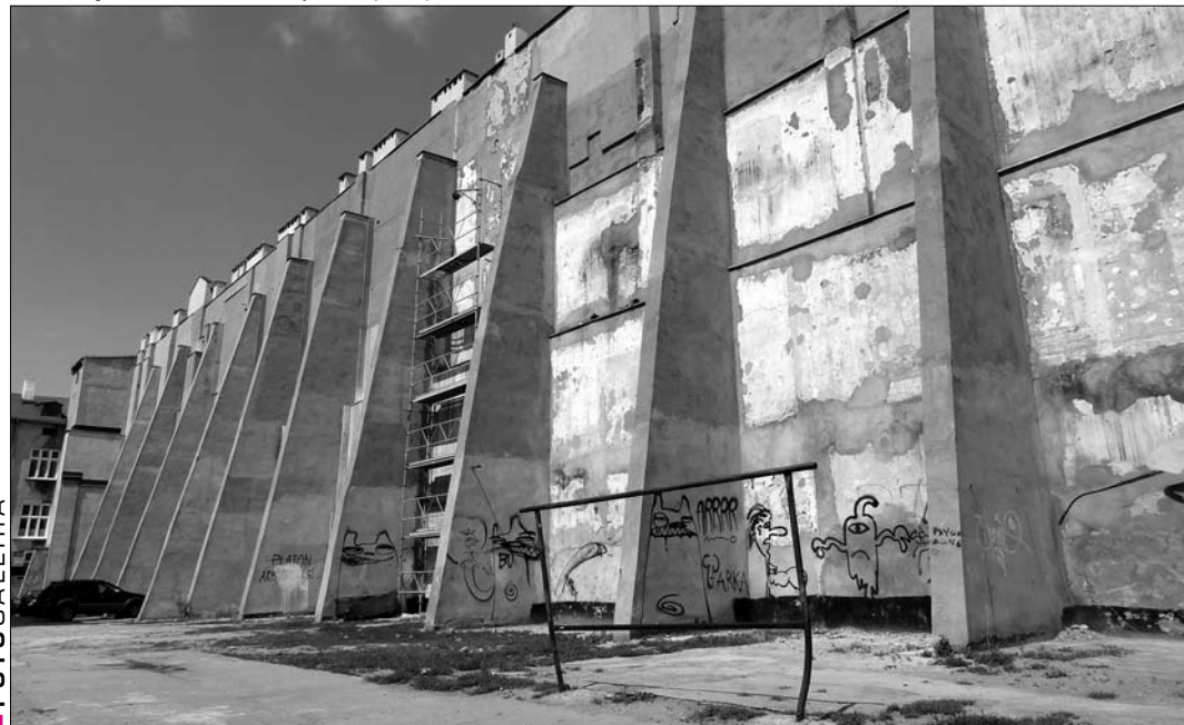
z cyklu Ukryte w podwórkach