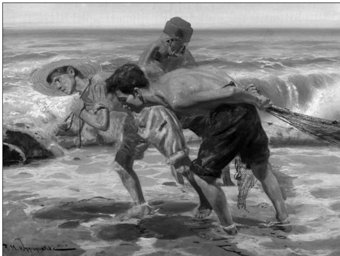
Obraz Feliksa Michała Wyrzywalskiego – wystawa w Muzeum Miasta Łodzi (od 29 VI)