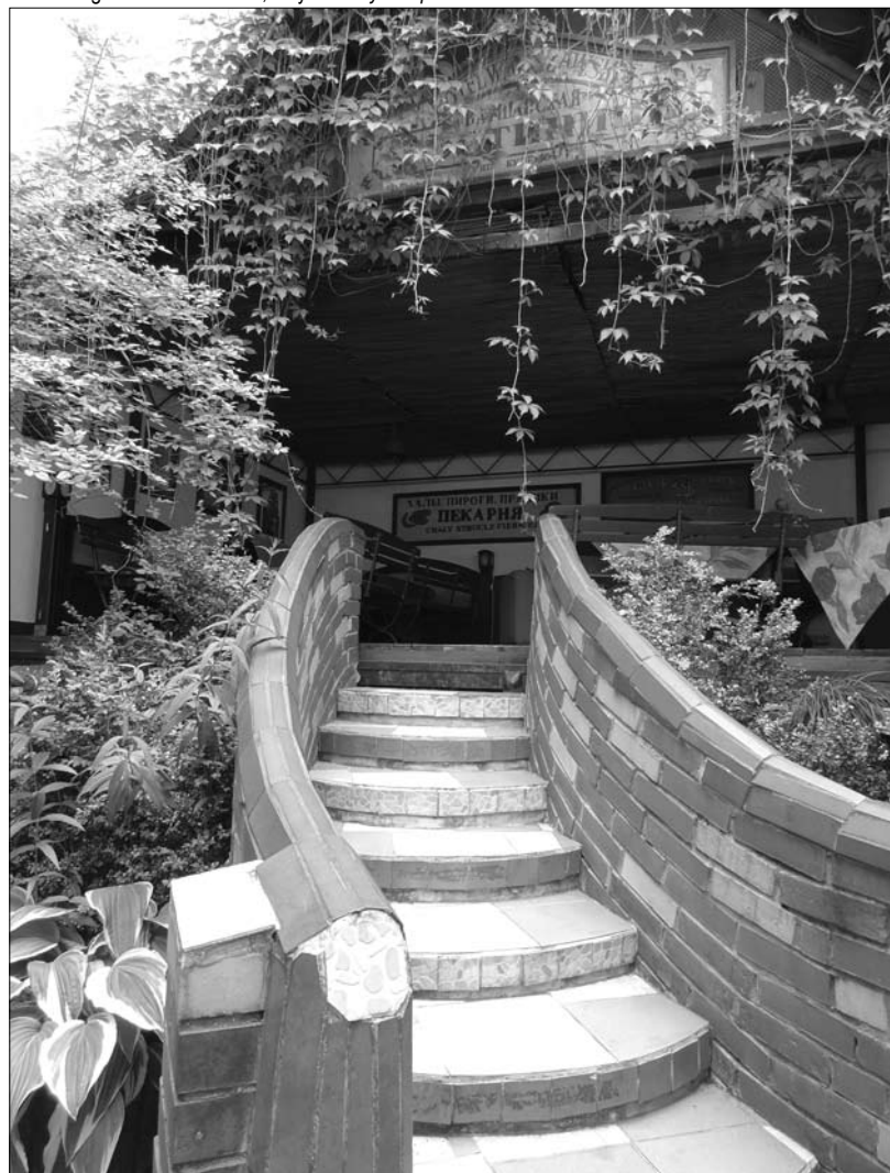
z cyklu Ukryte w podwórkach