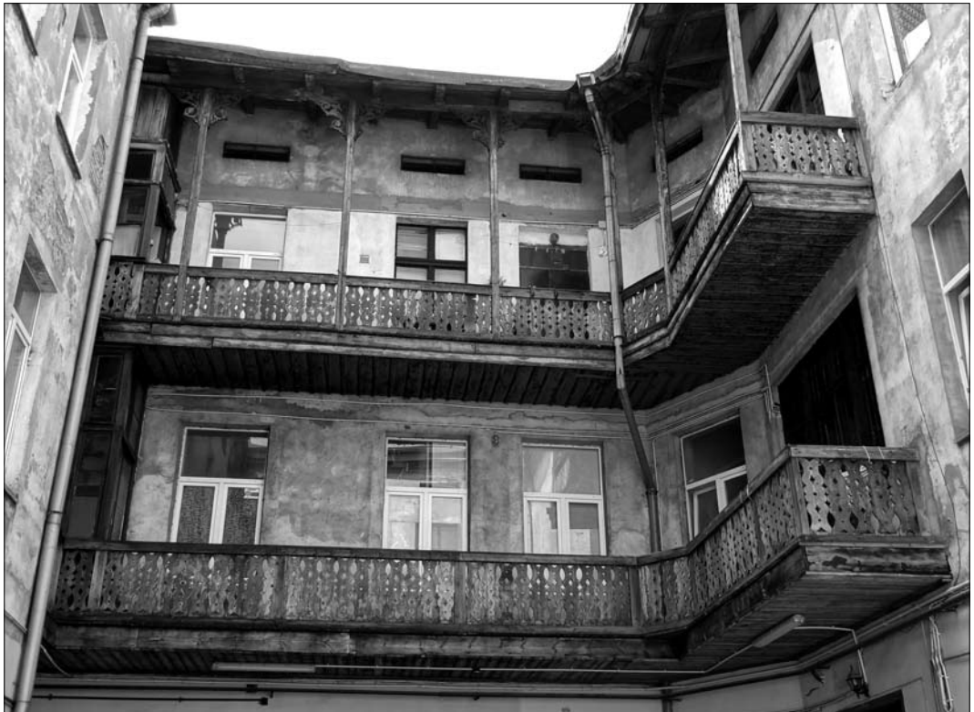
z cyklu Ukryte w podwórkach