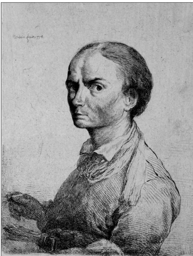
■ GALERIA KALEJDOSKOPU