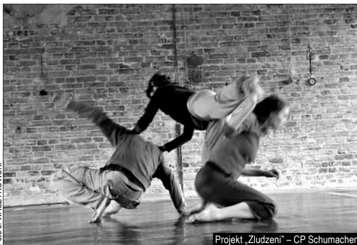
Projekt „Złudzeni”