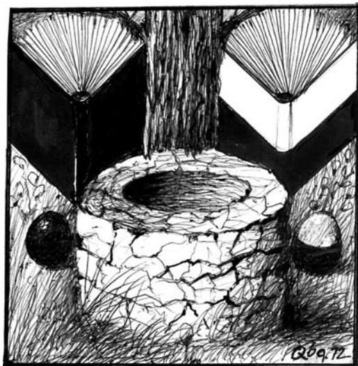
rys. Ryszard Kuba GRZYBOWSKI