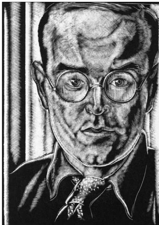
■ GALERIA KALEJDOSKOPU