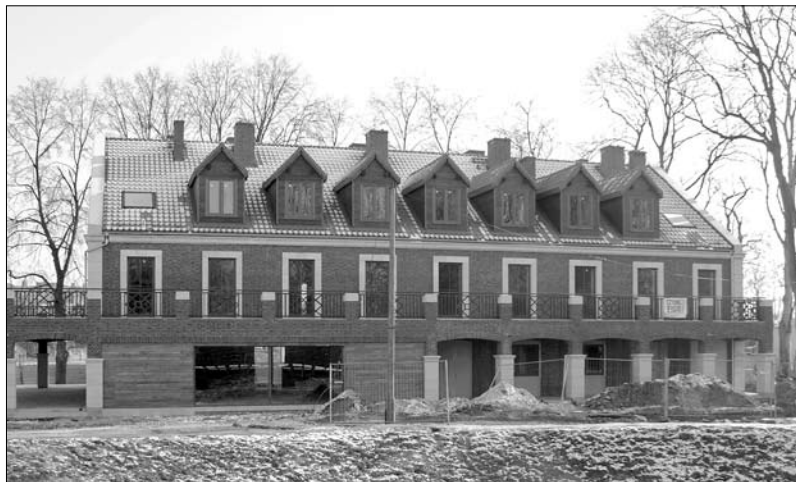
Dom Pracy Twórczej