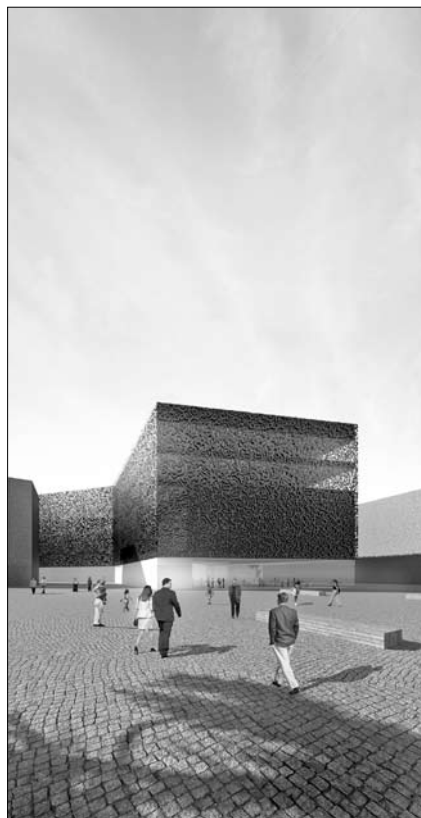
Projekt Specjalnej Strefy Sztuki

Specjaliści z Tamizo projektują też wnętrza. Zaczynają od znalezienia rozwiązań funkcjonalnych. – Do-